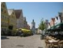
Tagesetappe 94km - Gesamt Donau 307,5km - Gesamt 323km